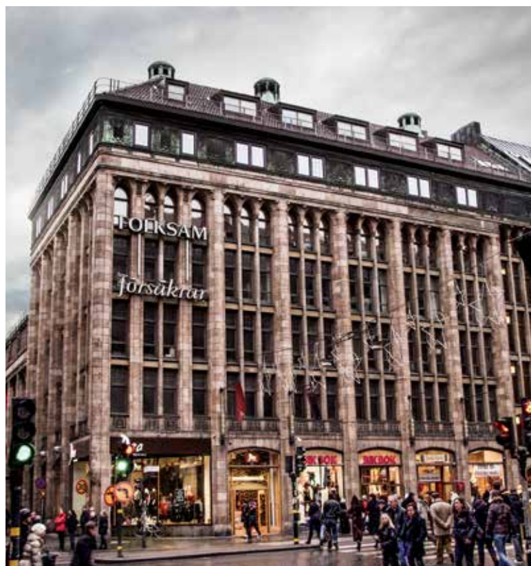
Du hittar oss på Kungsgatan 5, mitt i centrala Stockholm.

Minsta insättningsbelopp är 100 kr, utom för specialfonderna Lannebo Småbolag Select och Lannebo Utdelningsfond.